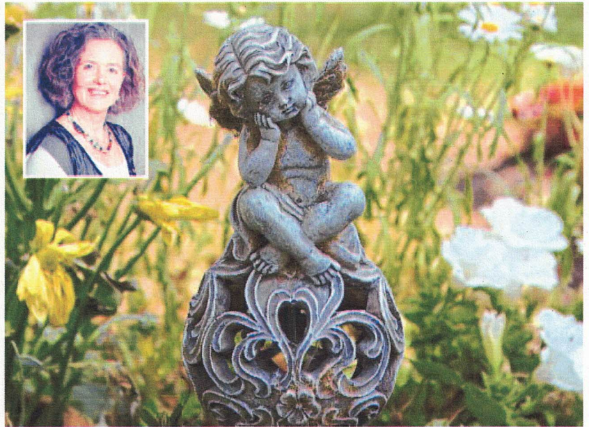
Das Zusammenkommen mit anderen Betroffenen, Gespräche und fachliche Begleitung helfen trauernden Eltern, mit dem Verlust ihres Kindes umgehen zu können.

► Gesprächskreis für Paare ab Oktober 2020: Das Angebot richtet sich an Paare, die in einer festen Gruppe mit anderen Paaren über besondere Vorkommnisse durch und nach dem Tod ihres Kindes sprechen und nach Impulsen für den weiteren Lebens- und Trauerweg suchen möchten.